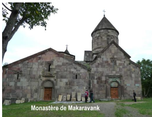
Monastère de Makaravank

Norik P. précise que l'établissement a donné de très nombreux diplômés (26 académiciens, des officiers supérieurs, etc...). Il ajoute que la présence de nombreux francophones (enseignants et étudiants) peut faciliter la visite du monastère de Moravank, (Xe-XIII e siècle) , situé à environ 7km du village. Le site est exceptionnel, tant pour son cadre naturel que pour sa qualité architecturale. Les habitants d'Ajadour s'y retrouvent souvent pour y célébrer des fêtes comme Vartavar ou des mariages.