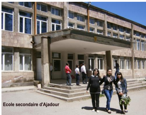
Ecole secondaire d'Ajadour